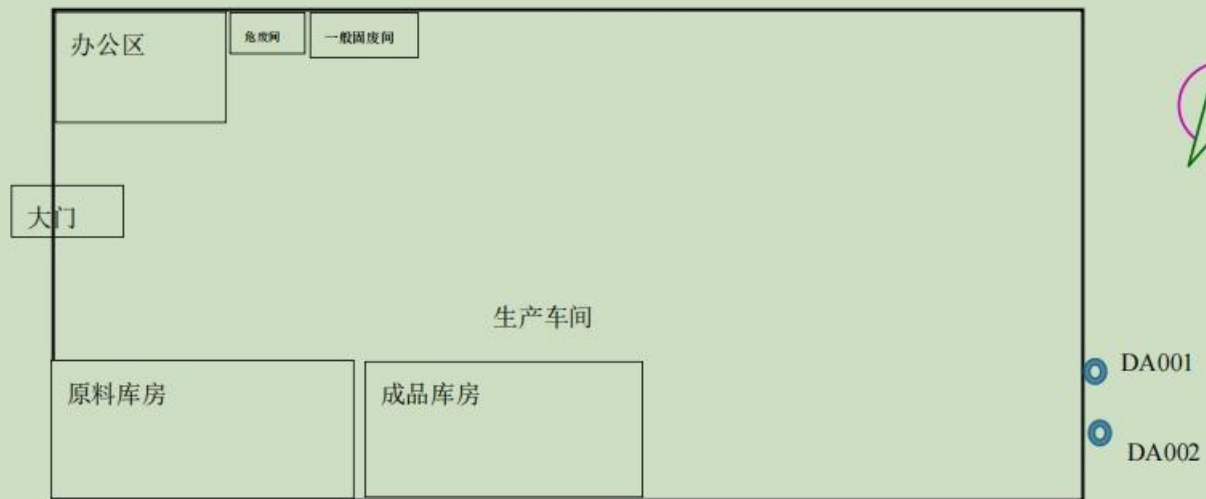
附图 3 平面布置图