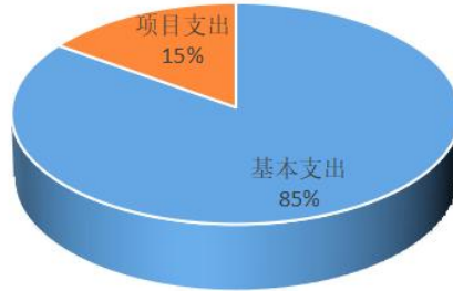
2022年基本支出、项目支出情况表