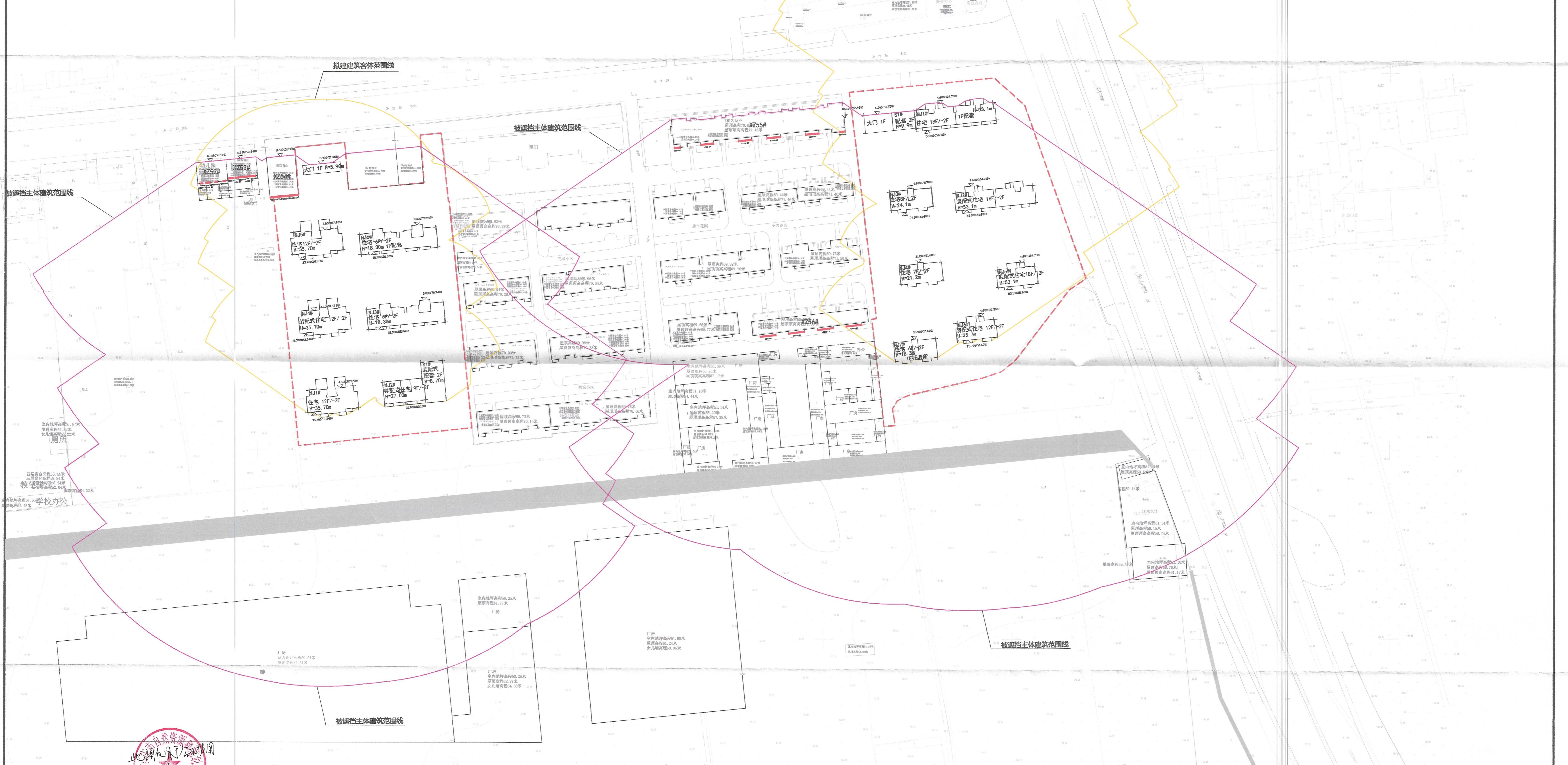
周边现状住宅窗户定位图 1:1000

备注：1、本技术报告仅适用于附图所限定的项目周边现状建筑的情况，“XZ”表示现状建筑，“NJ”表示拟建建筑。 2、建筑主体高度，坡屋顶建筑为正负零至屋脊顶，平屋顶建筑为正负零至女儿墙顶。 3、现状被遮挡住宅窗户点位 需分析现状被遮挡住宅建筑窗户XZ1#-XZ56#现状楼，其居室窗户点位如图示 4、日照分析计算结论 现状被遮挡住宅建筑XZ1#-XZ56#中有23处受影响，建前建后窗户沿线日照比较分析详见日照分析报告附表2 5、图例：